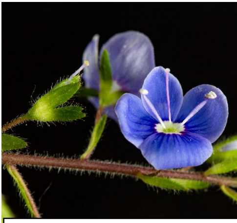
Die Kronblätter fallen bei Erschütterung schnell ab: Name „Männertreu“