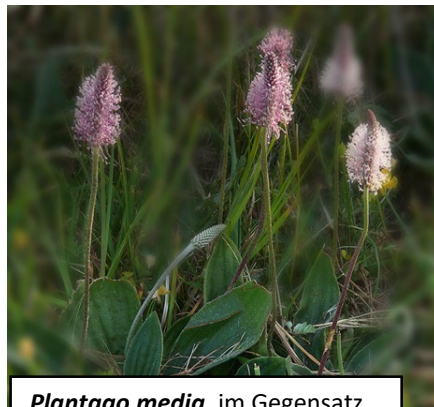
Plantago media , im Gegensatz zu ~lanceolata und ~major wächst Plantago media mit ungestielten Blättern eher auf mageren Wiesen