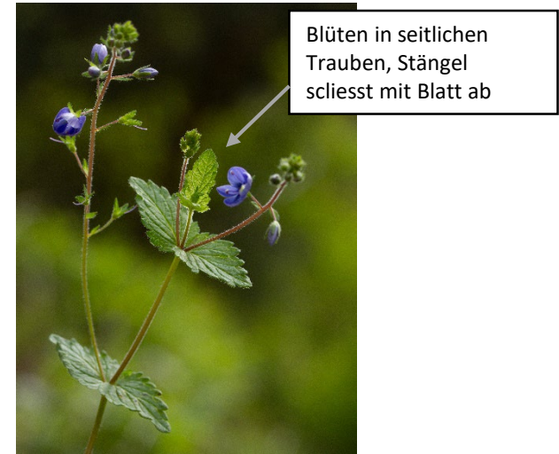
Blüten in seitlichen Trauben, Stängel scliest mit Blatt ab