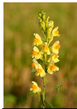
Linaria vulgaris , ein Rohbodenpionier auf Schuttplätzen, auch auf Karlsruhes Baustellen!