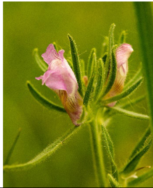
Misopates orontium , das wilde Löwenmäulchen ist eher eine seltene Pflanze des Mittelmeerraumes, trifft man aber zwischenzeitlich auch ab und zu in Karlsruhe an, so wie dieses auf der Wiese hinterm Audimax