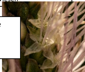
Vierzählige Blüte von Plantago media