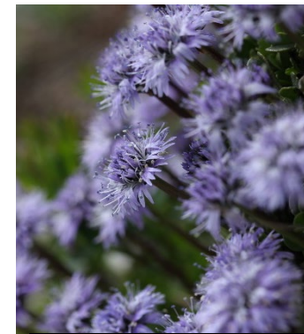
Globularia cordifolia , eine Alpenpflanze, die bis 2800 m Höhe gedeiht