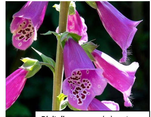
Digitalis purpurea , bekannt durch die Digitalis-Glycoside, klassisches Mittel gegen Herzinsuffizienz